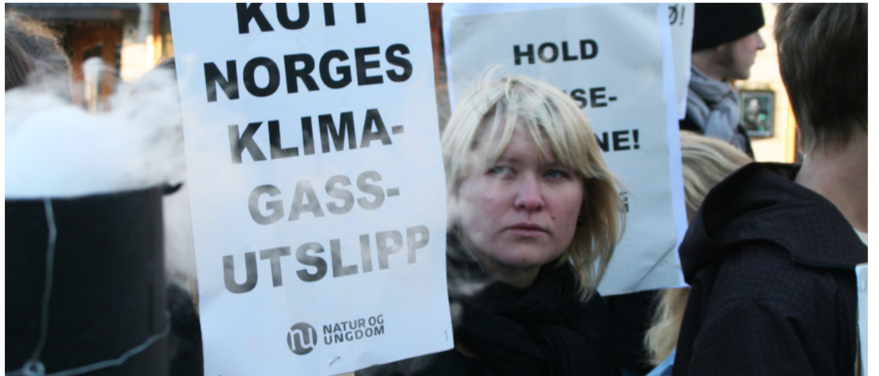
Klimagasskutt: Rødt vil at Norges klimagasskutt skal tas i Norge.