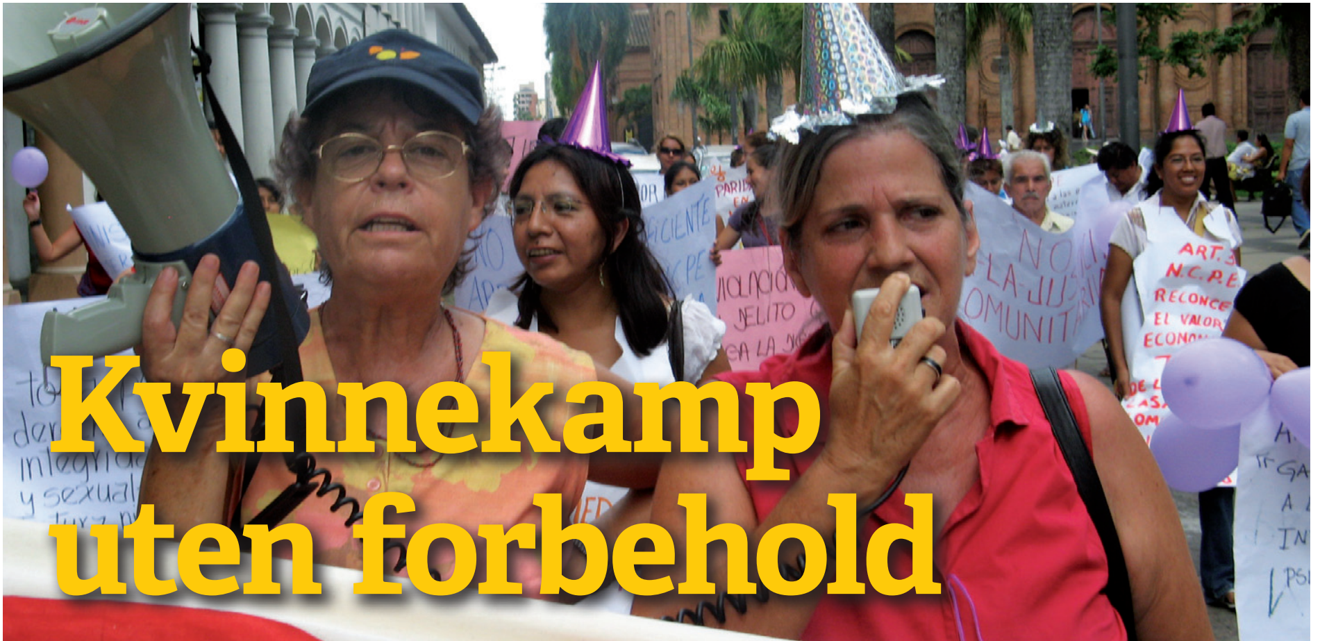
8. mars: Colectivo Rebeldía marker kvinnedagen.