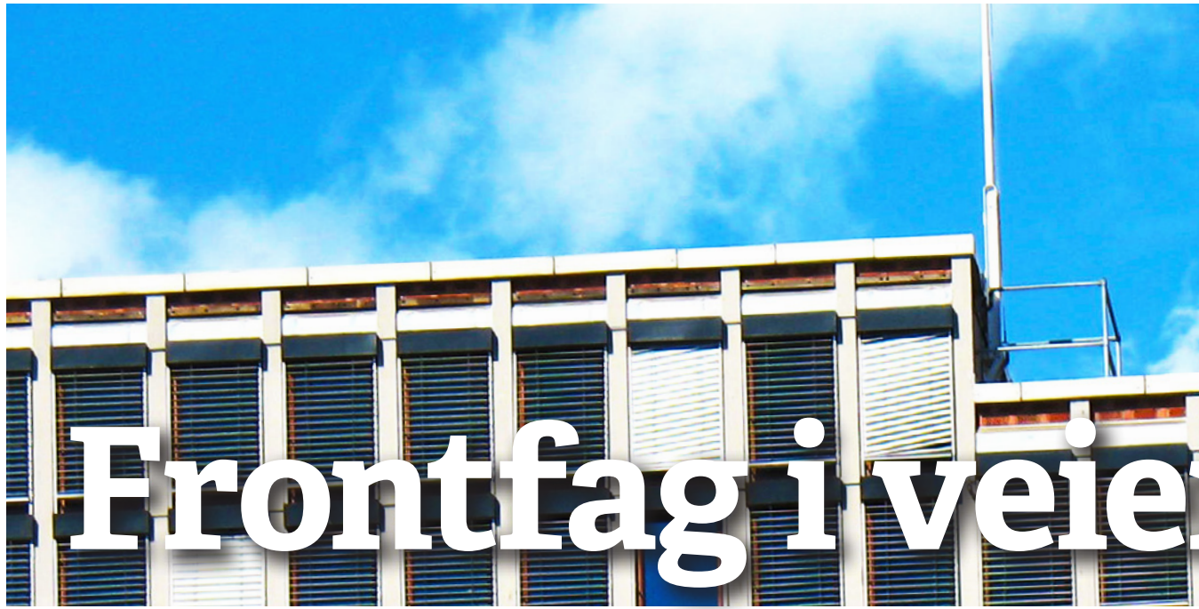
LO: Forsvarer frontfagsmodellen til tross for manglende likelønn.

Utgiver: Rødt Osterhaus' gate 27 0183 Oslo