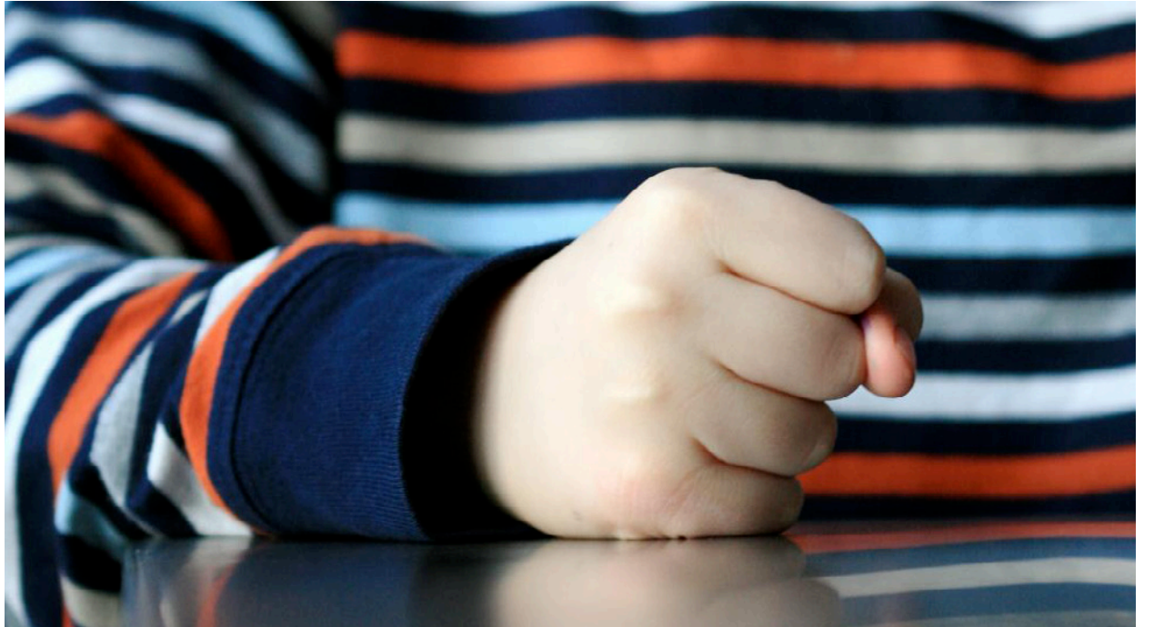
Krev din rett: Ulike kvinnegrupper må samles rundt kravet om rett til arbeid.

– Eg trur det vil dreie seg om område der likestillingstiltak blir sett på som eit hinder for den frie flyten og auka konkurranse. Eksempla over illustrerer også type område der EØS kan stå i vegen for likestillingstiltak også i framtida.